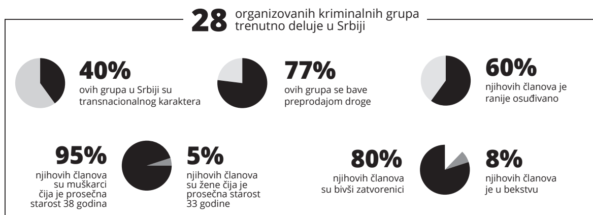
Grafikon 1 Organizovane kriminalne grupe u Srbiji 482

Nije postignut napredak u procesuiranju organizovanih kriminalnih grupa uz zvaničnu podršku i potvrđivanje Tužilaštva za organizovani kriminal. Tužilaštvo se ne oglašava povodom javno iznesenih tvrdnji o vezama političara i članova organizovanih kriminalnih grupa, koje je izneo, ni manje ni više, nego bivši načelnik Uprave kriminalističke policije. 483 Istovremeno, izvršna vlast neprestano komentariše istrage koje su još u toku, zanemarujući Tužilaštvo za organizovani kriminal. Najnoviji primer je slučaj Filipa Koraća, koga je predsednik Republike naveo kao glavnog švercera droge u Srbiji. 484